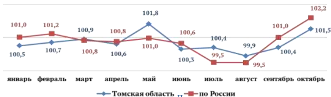
Индекс цен на продовольственные товары (включая алкоголь) по Томской области, 2021 г., в % к предыдущему месяцу

Сложившаяся динамика цен в Томской области характерна и для всей России в целом, удорожание продовольствия обусловлено ростом себестоимости продуктов, ввиду заметного увеличения стоимости сельхозсырья, плохими погодными условиями, сказавшимися на неурожайности овощей и мировыми ценами.